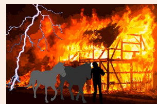
Brand und Explosion